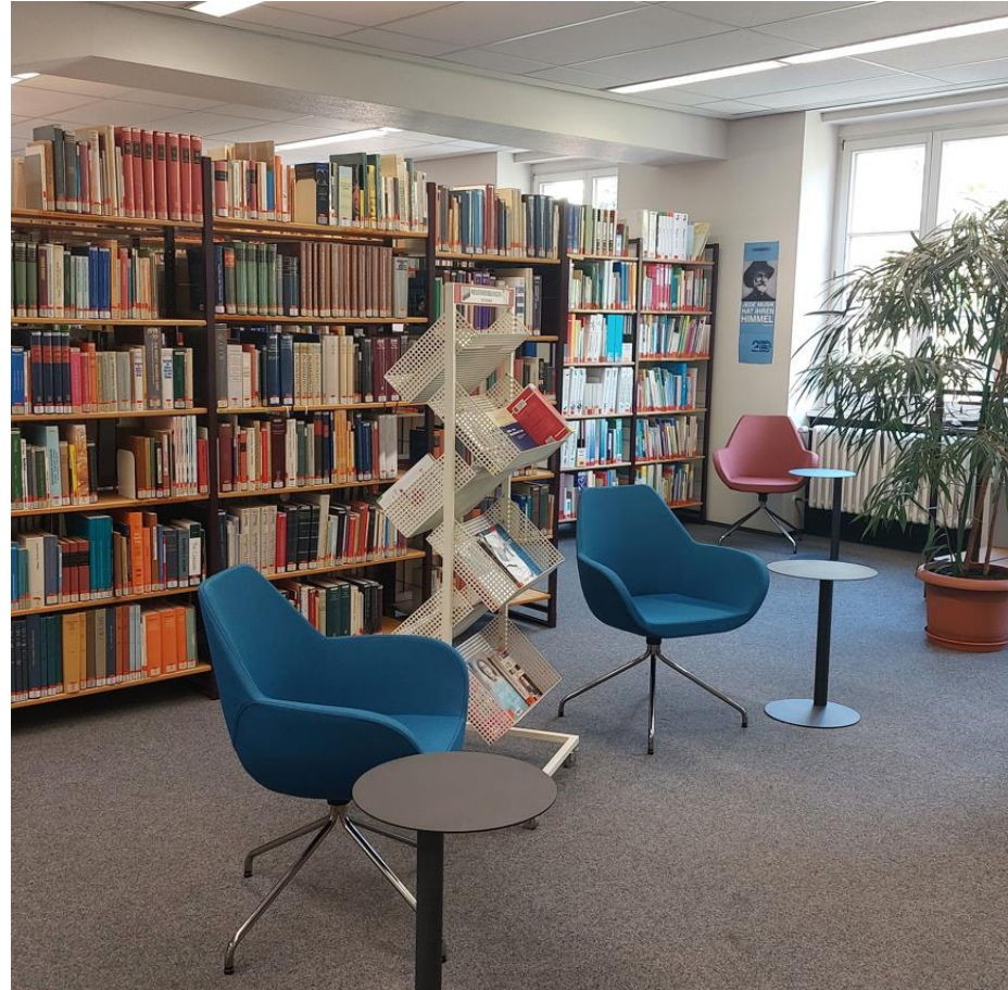
Die Bibliothek stellt sich vor